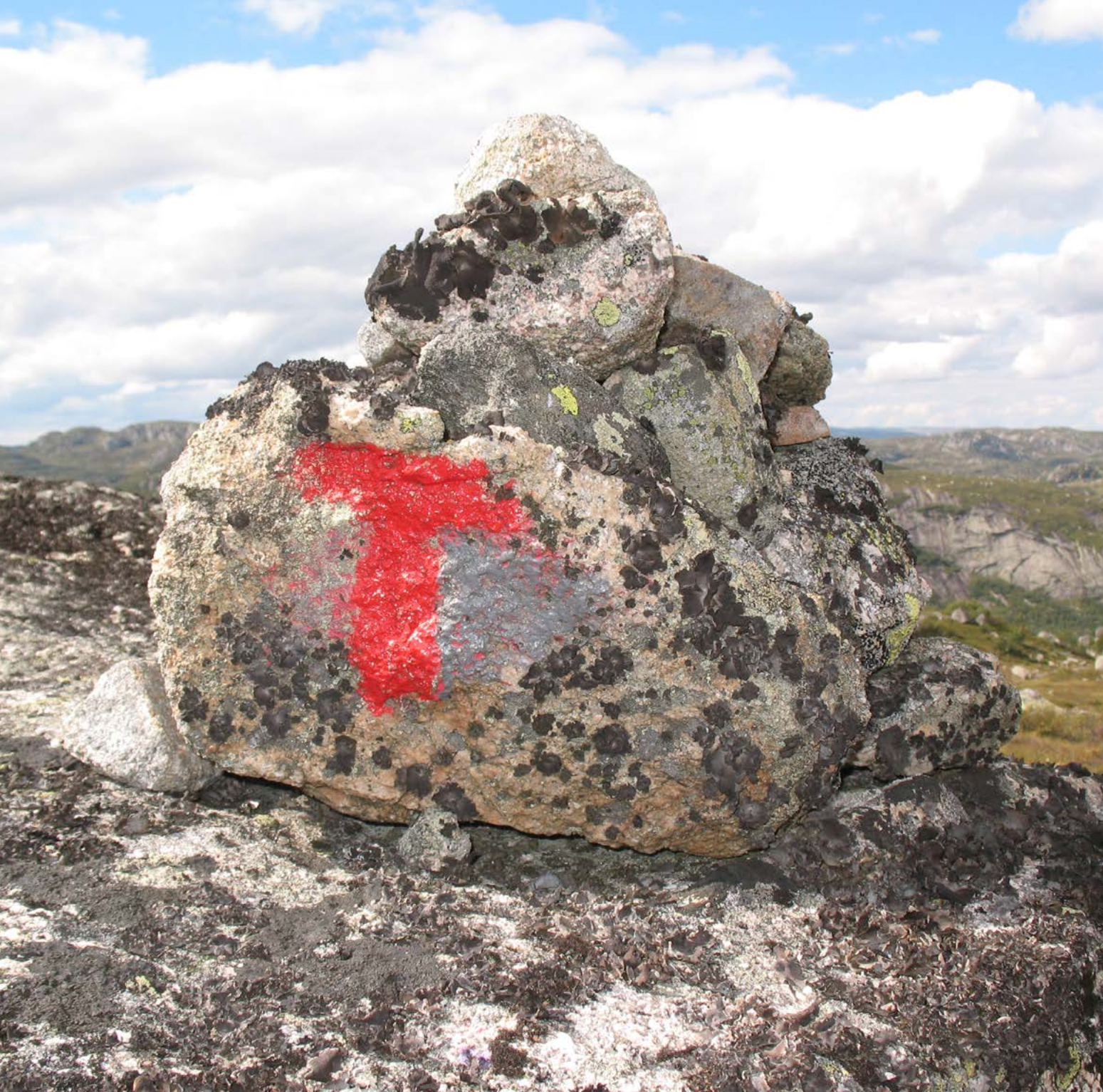
Turistforeningsmerke i fjellet.