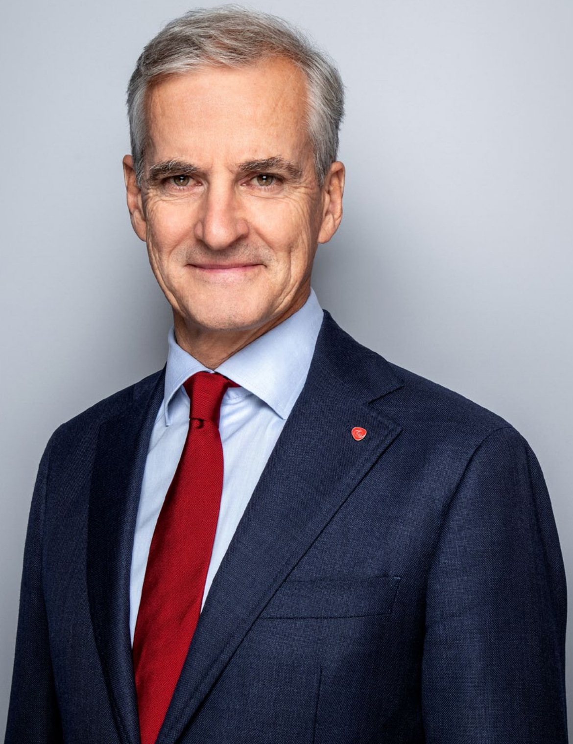
Jonas Gahr Støre.