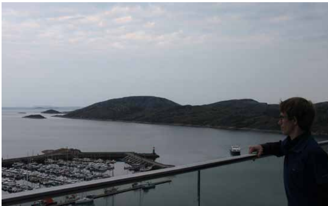
Utsikten fra restauranten i 17 etasje.