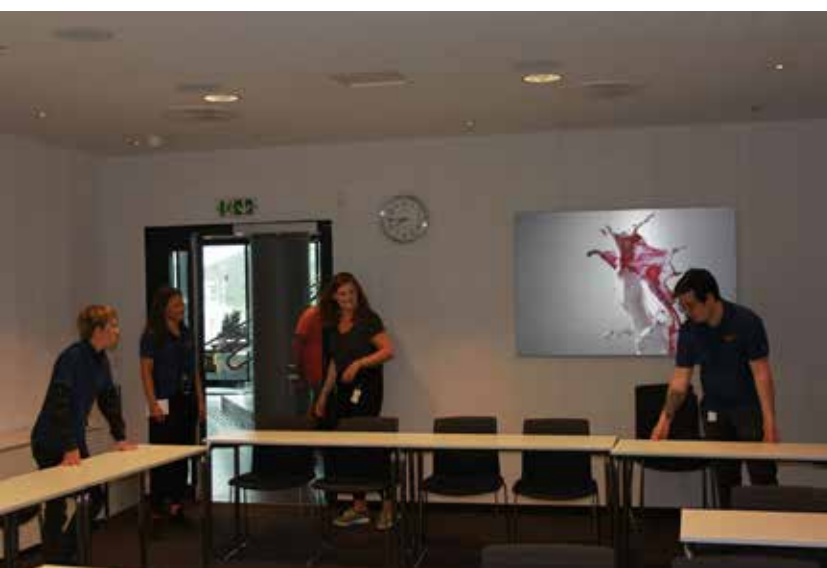
Diverse arbeidsoppgaver gjennom arbeidsdagen.

arbeidsdagens slutt. Tarjei har en fast dagsplan som han følger med liste på hvordan dagen ser ut og hva som må gjøres. «Dette gir meg oversikt over de