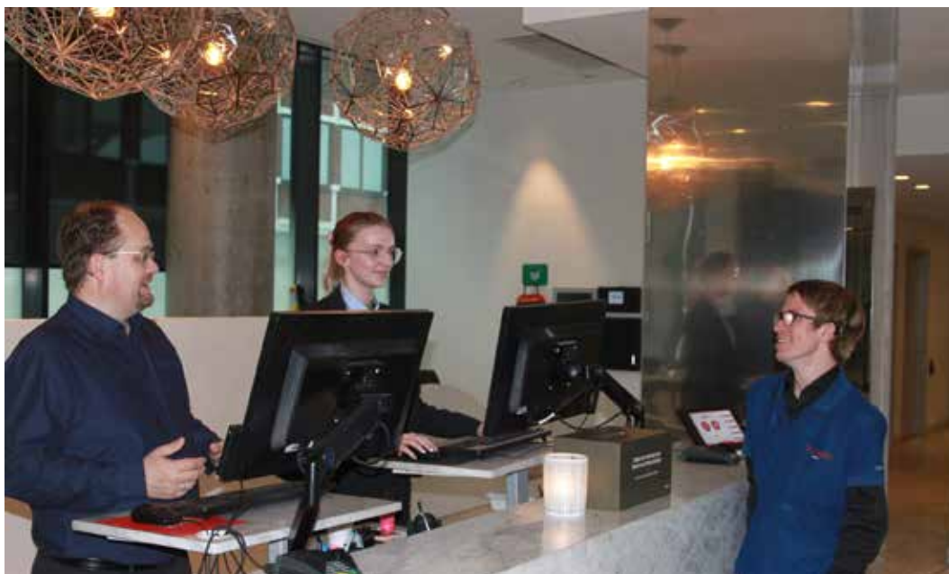
God stemning i resepsjonen.