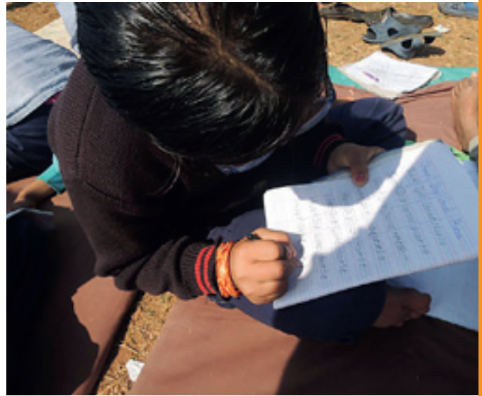
Vanlig skoledag.

Vi opplevde også at kulturforskjeller skapte utfordringer. Holdninger og normer som for oss er selvfølgelige, er ikke nødvendigvis gjeldende i Nepal. Vi måtte stadig reflektere over egne verdier fordi vårt tanke sett ikke uten videre kunne overføres til en annen kultur. Vi diskuterte stadig bakgrunnen for våre egne tanker og verdier, med den hensikt å kunne opptre med respekt i en ukjent kultur.