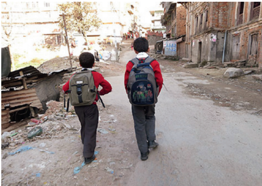
To gutter på skolevei.

En kombinasjon av at skolen ikke er tilpasset barnas behov og skammen knyttet til at disse barna skal vises i offentligheten, gjør at mange foreldre vegrer seg for å sende barna på skolen.