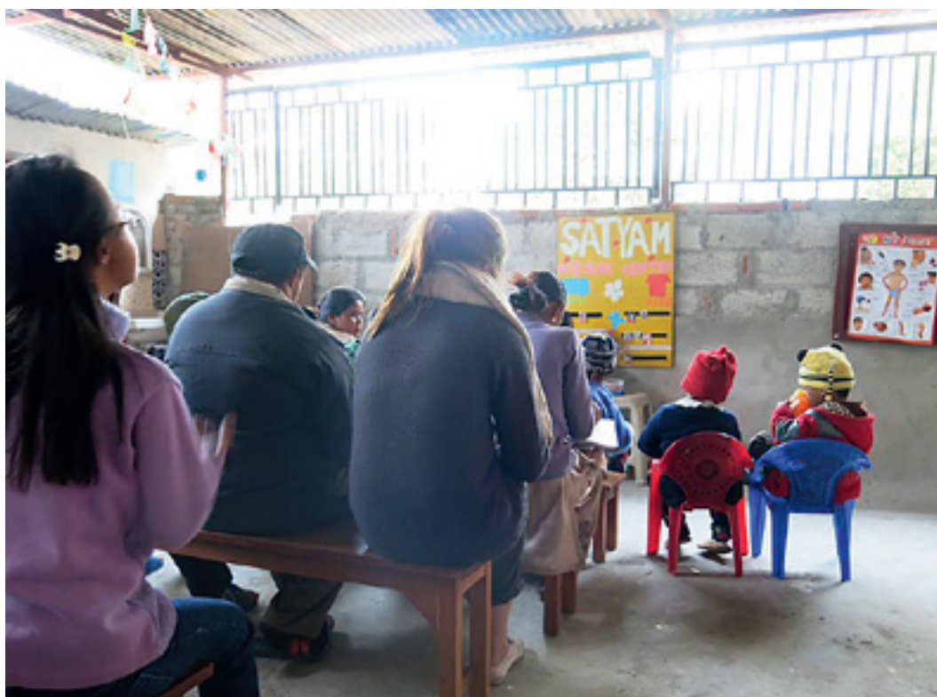
Morgenstund på dagsenter.

neglisjert og oversett i samfunnet. Vi ble fortalt at myndighetene har et lovverk som skal sikre rettighetene til personer med funksjonsnedsettelse, problemet er at det ikke håndheves. Det har skjedd en gradvis forbedring de siste årene, men vi erfarte at det i Nepal fortsatt blir ansett som en stor skam og en straff fra «gud» å få et barn med funksjonsnedsettelse. I Nepal er hinduismen den rådende religionen. Rundt 80 prosent av befolkningen er hinduister. I følge hinduistisk tro, vil det å få et barn med funksjonshemming være en straff for synder man har begått i tidligere liv. Mange av barna, spesielt i lavlandet og på landsbygda, blir gjemt bort og holdt skjult fra omverdenen.