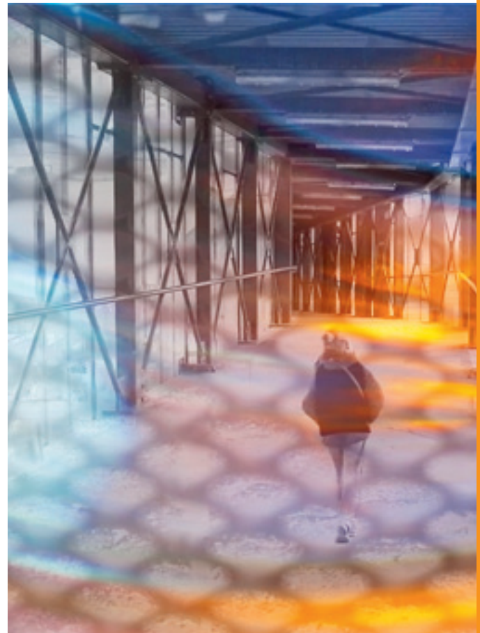
«Jeg når ikke fram.»