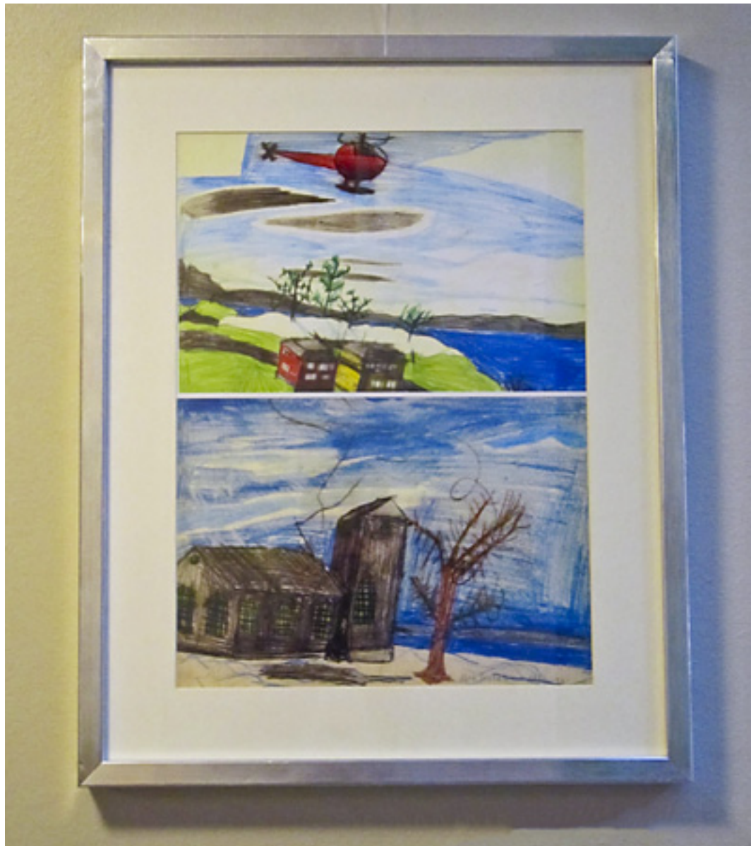
Disse bildene er tegnet på 60-tallet.

henseende at en del beboere ønsket, enten å starte opp igjen med å skape, eller hadde blitt inspirert til å gjøre det for første gang.