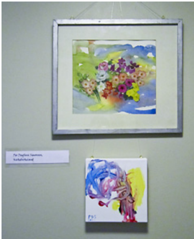
Mange ulike teknikker ble vist på utstillingen.

eller være anonym. På denne måten sikret vi at beboerne sine ønsker om hvordan de ville bli presentert ble tatt til følge.