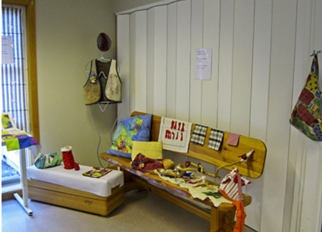
Beboerne har også laget puter, duker, klær og andre gjenstander.

med på utstillingen. I utgangspunktet tenkte vi at det var en grei jobb, men det ble lagt ned mange timer og mye arbeid på å få dette i stand.