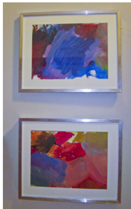
Flotte malerier i forskjellige farger. Utrolig hvor fint ting blir når man får ramme på.

Før vi takket ja til tilbudet fra kompetansenheten, visste vi ikke hvor mye arbeid det faktisk ville innebære å få til en slik kreativ prosess og utstilling. For det var mye arbeid, men det var verdt det, for