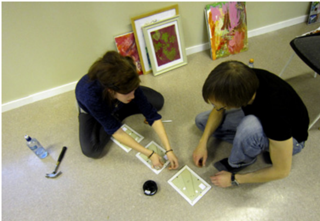
Vi brukte litt tid på å lage oppheng på bildene.