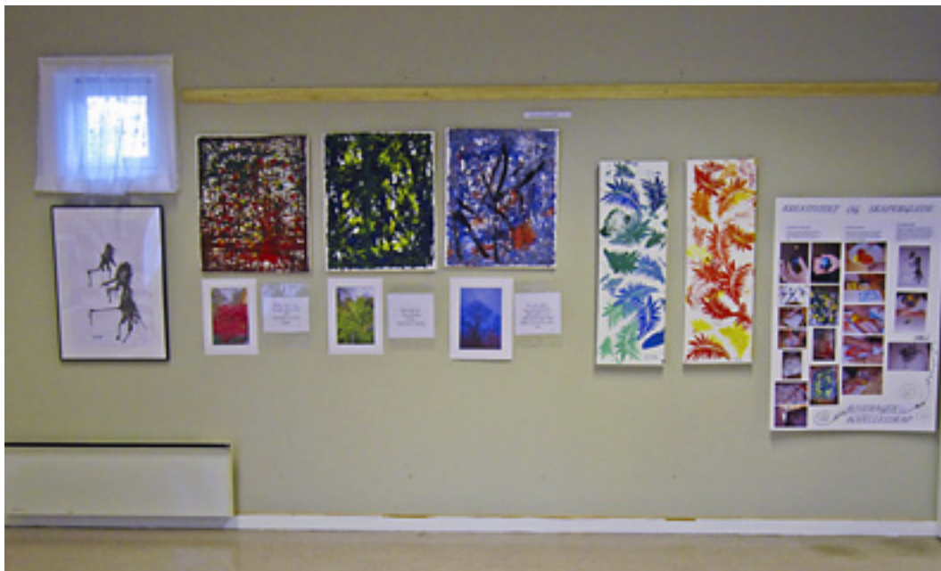
Tre forskjellige teknikker. Fra venstre maling og sugerør, klinkekulemaling og trykk.