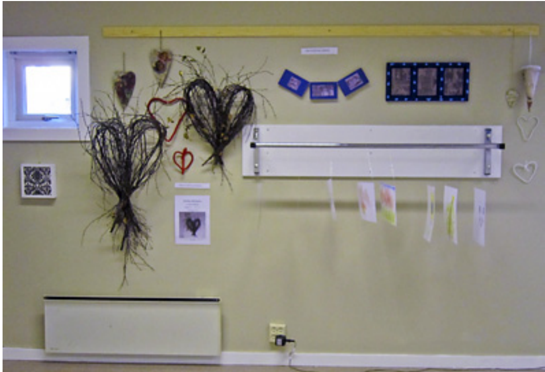
Mange forskjellige ting laget av en beboer. Hun har i ettertid hatt egen salgsmesse.

beboerne mulighet til å ta opp igjen eller fortsette med tidligere interesser. Og å motivere de som tilsynelatende ikke hadde noen interesser i en slik retning til å få det. Målet var å stimulere til aktivitet og kreativitet og skape ny kunst frem mot utstillingen.