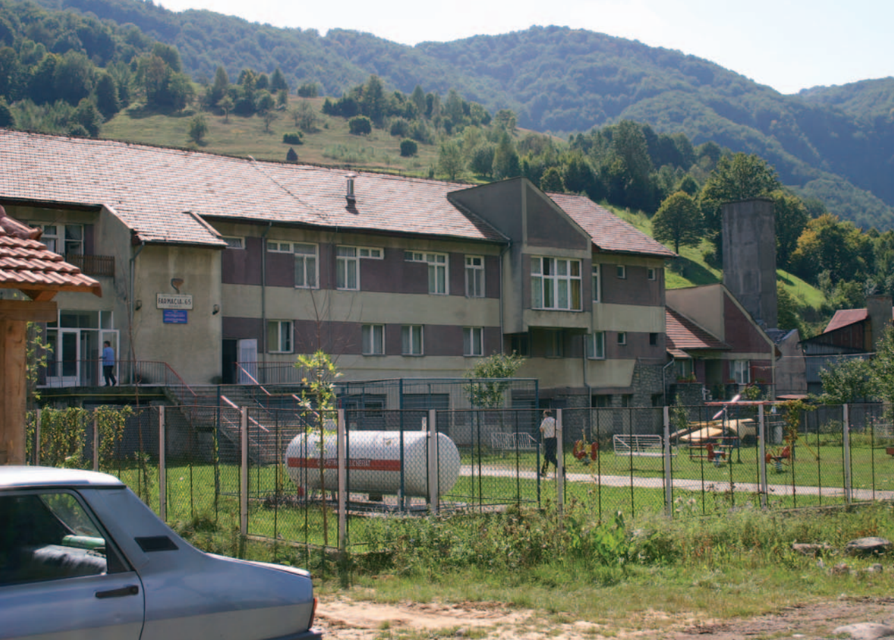
Barnehjemmet i Remeti.

renovering, nye møbler og mye annet som var nødvendig. I årene fram til i dag er huset pusset opp, renoveret og utstyrt til dagens nivå. Barnehjemmet fremstår i dag som rent, ryddig og stort sett i bra stand.