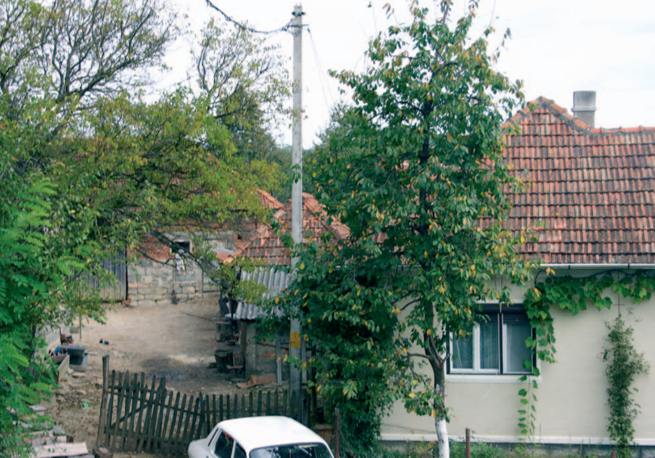
En av gårdene der unge voksne bodde i familieenheter.

poteter i år. I tillegg til arbeidet de utfører på egen gård, ber bøndene i området dem ofte om hjelp til dette eller hint. Det gir ekstraintekter. På samme måte som når de selger varene sine på markedet, og får litt ekstra for det. En forteller at han har planer om å gifte seg, og alle snakker i munnen på hverandre om alt som skal til av forberedelser. Det er tydelig at de er opptatt av å hjelpe hverandre.