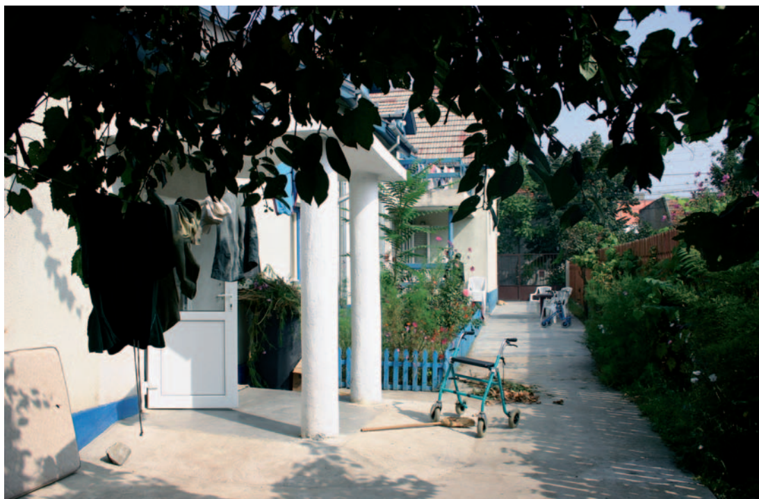
Bofellesskap i Oradia.