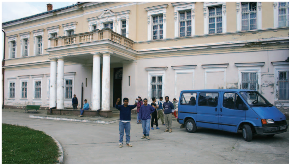
Institusjonen i Cadea.

oppbygging av et differensiert omsorgssystem. Romania har vanskelig økonomi, og det er ikke realistisk at institusjonene vil bli erstattet med små hus i overskuelig framtid. Det viktigste blir derfor å gi folk tilbud om aktivitet, omsorg og nærhet på de institusjonene en har.