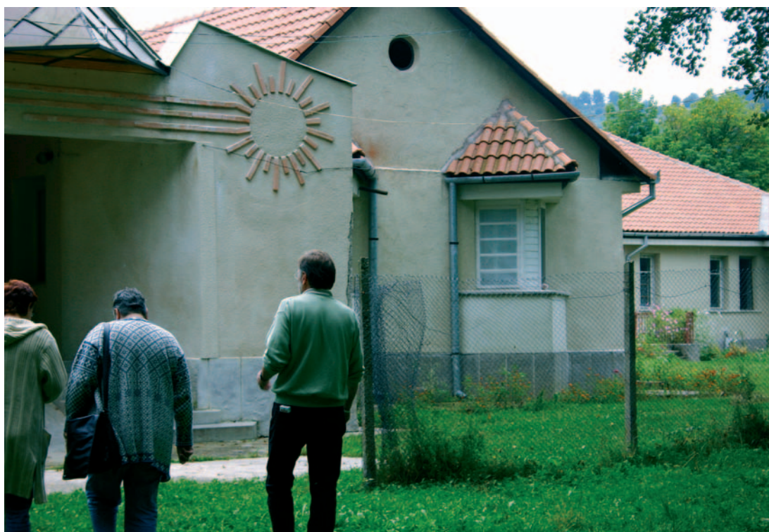
Institusjonen i Bratca som sorterte under sosialmyndighetene.

Vi, som har tråkket våre «barnesko» på sentralinstitusjonen Vestlandsheimen, kjenner igjen mye i det nye systemet, som har relativt bra bemanning og rimelig god økonomi. Det nye tilbudet erstatter et langt dårligere tilbud, men det er fortsatt langt igjen til det materielle nivå vi kjenner fra norske bofellesskap for utviklingshemmede. Den informasjonen vi får tyder på