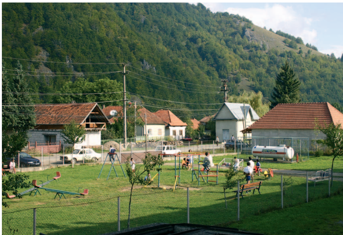
Lekeområdet utenfor barnehjemmet i Remeti.