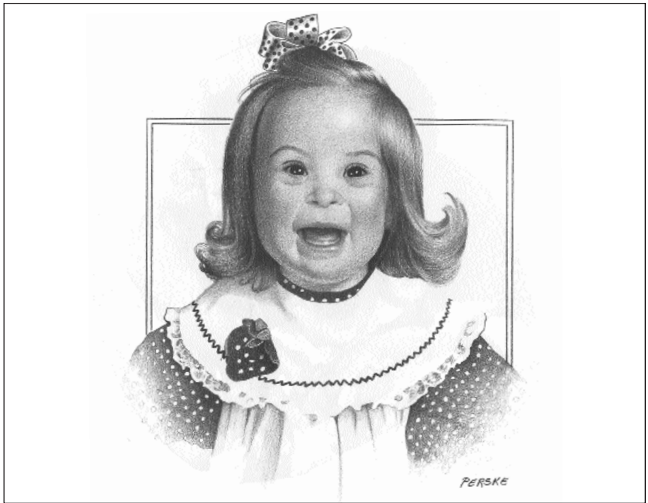
Tegning reproduisert med tillatelse av Martha Perske fra PERSKE: PENCIL PORTRAITS 1971–1990 (Nashville: Abingdon Press, 1998).

Det er imidlertid signifikant sammenheng mellom tjenesteyternes alder og bruk-