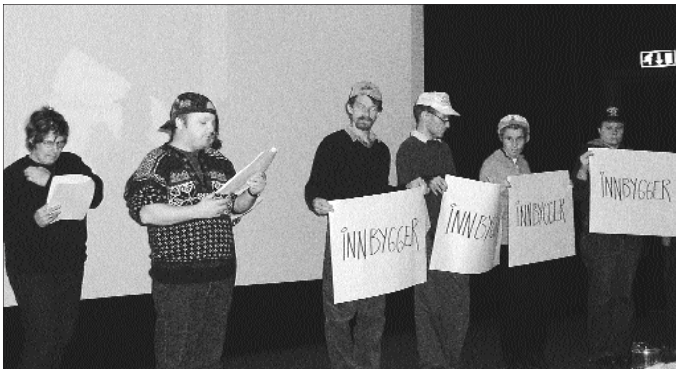
Fra rådgivningsgruppen i Bærums konferanse om selvbestemmelse.