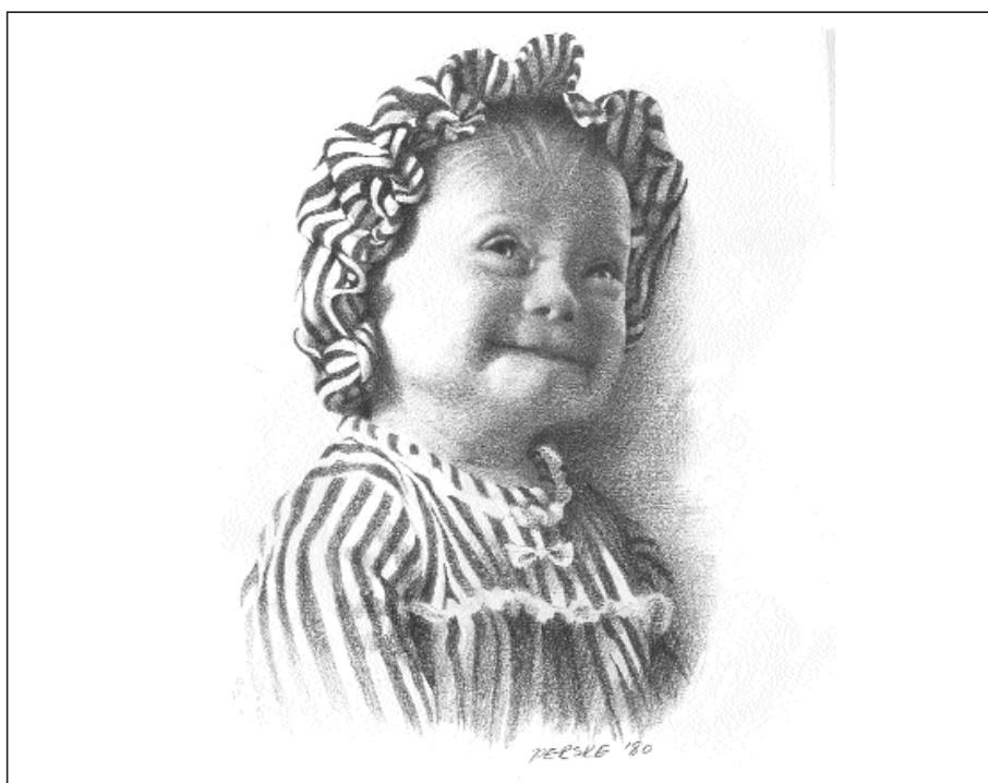
Tegning reproduisert med tillatelse av Martha Perske fra PERSKE: PENCIL PORTRAITS 1971–1990 (Nashville: Abingdon Press, 1998).

I felt nr 3 kan man tenke seg at en person i likhet med felt nr 1 er i en situasjon med underskuddsbehov, og hvor dette er blitt til et offentlig anliggende. Omsorgsovertakelse kan være et slikt eksempel. Her er det